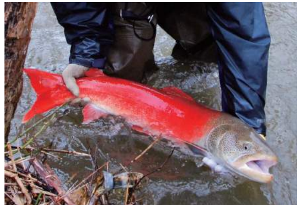
図3. 婚姻色の現れたオスのイトウ。

サケの定置網に混獲されるイトウは現在でも少なからずいるようである。極東ロシアでは、古くから相当な数のイトウがサケマス漁の混獲物として漁獲されてきた。60年代以前、極東ロシア全域で年間45-50トンほどが水揚げされていた。特に日本海のロシア領水域では20トンを超える漁獲があったが、60年代以降著しく減少してい