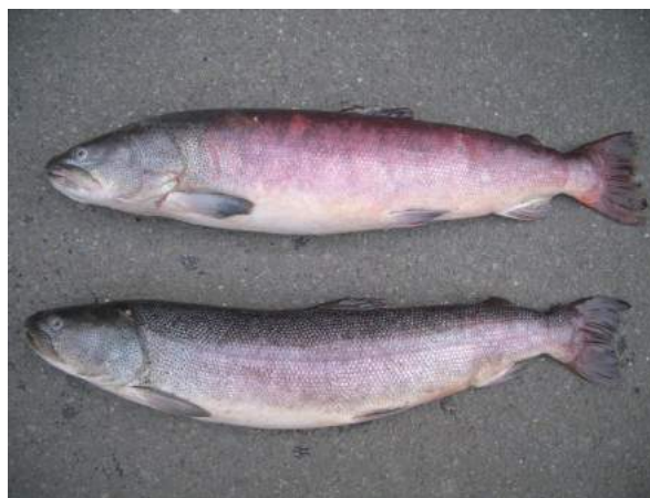
図1. オホーツク海沿岸でサケの定置網によって混獲されたイトウのオス (上: 尾叉長 90 cm, 17 歳) とメス (下: 尾叉長 92 cm, 20 歳)。年齢査定は耳石の年輪による。

Hucho 属魚類と異なり降海性を有する。しかし北海道で降海個体が確認されているのは道北や道東の限られた河川である。またダム貯水池などに陸封され世代交代している個体群が少ないことから、降海性は強くないと推察される。道北オホーツク沿岸流域に生息するイトウは3-4歳ではじめて降海し、その後 (産卵のため) 汽水域から河川上流への遡上を生涯にわたって繰り返すことが耳石の微量元素の分析によって示されている