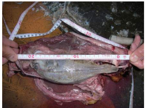
図4. イトウの胃から出てきたカレイの仲間。

る。80年代に1-2トンにまで激減し、90年代以降の記録は途絶えている(Zolotukhin et al. 2013)。