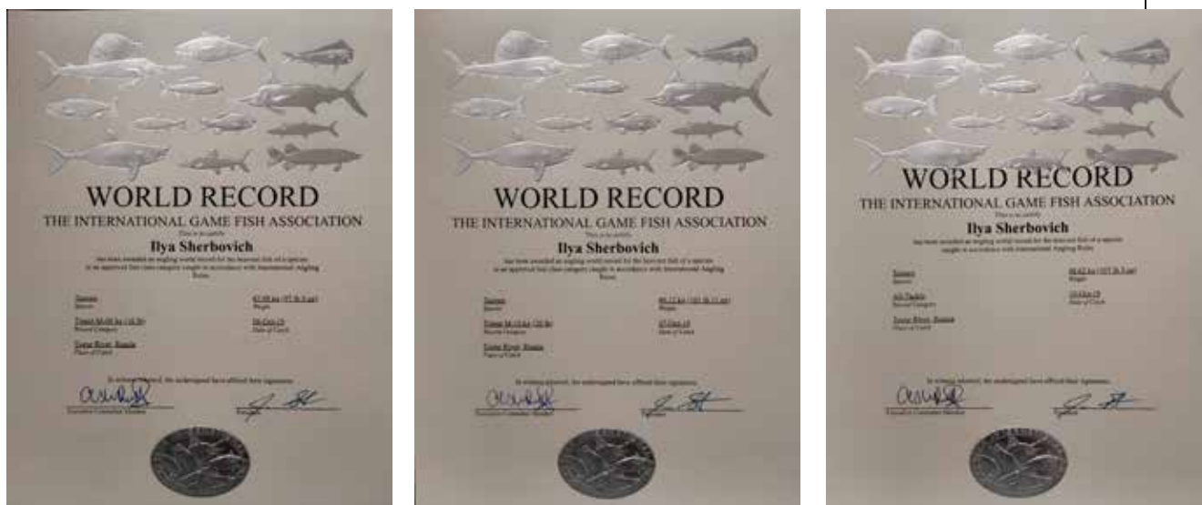
Рисунок 7. Образцы сертификатов международной ассоциации спортивного рыболовства (IGFA)